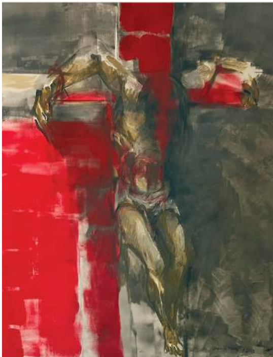
Cristo sobre la Cruz Óleo sobre tela 100 x 80 cm