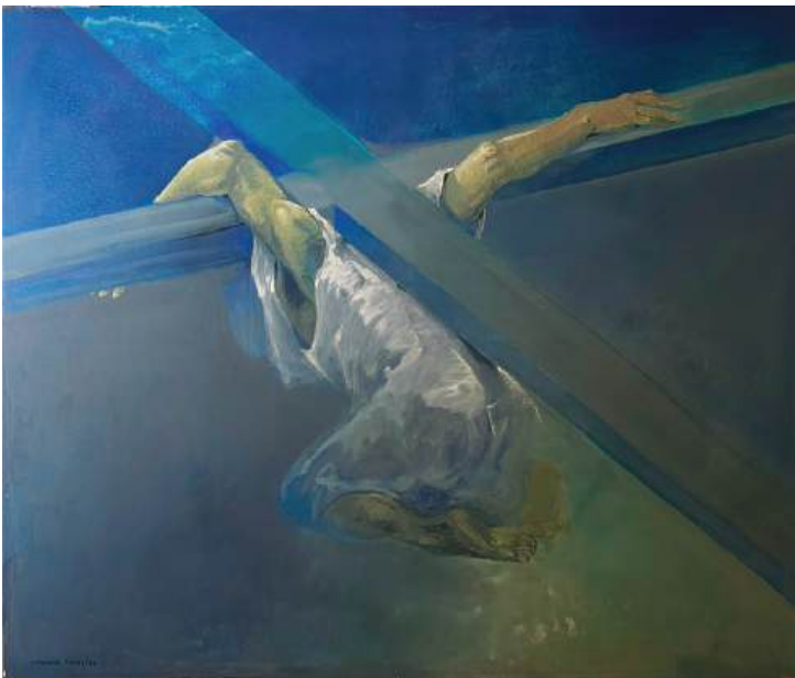
Segunda Caída Acrílico sobre tela 210 x 180 cm