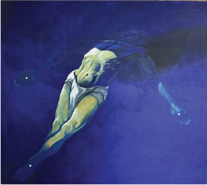
Cristo bajado de la Cruz Acrílico sobre tela 150 x 130 cm