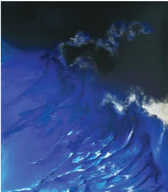
De la serie 'Los Mares' Acrílico sobre tela 180 x 210 cm