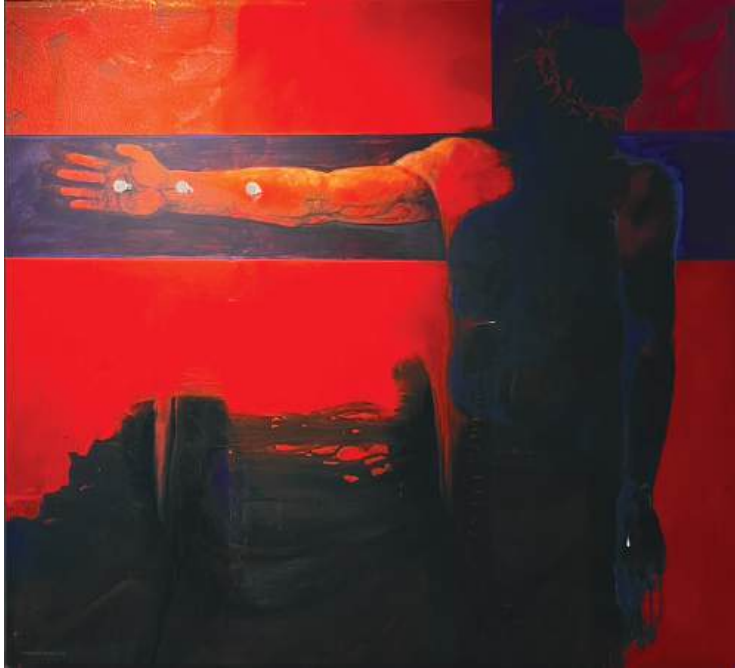
Cristo clavado en la Cruz Acrílico sobre tela 205 x 185 cm