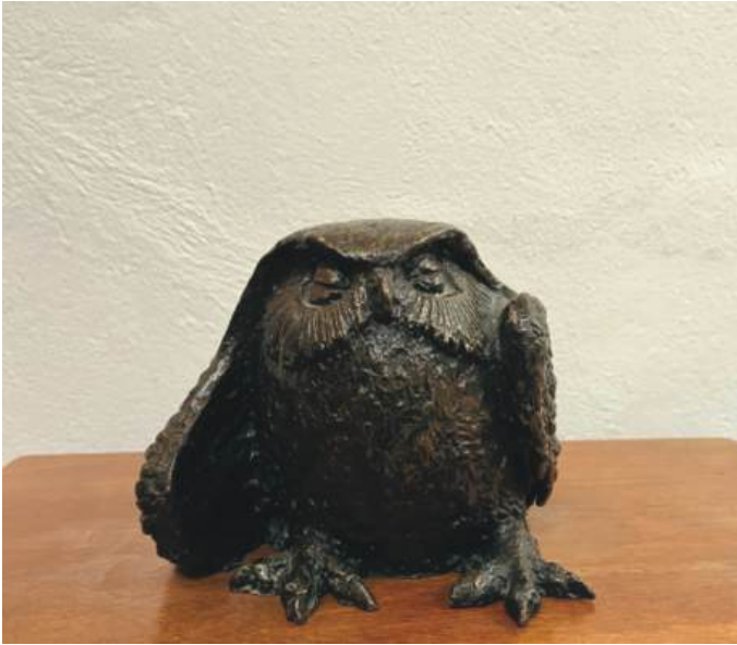
Sick Owl Bronze 18 x 19 x 16 cm